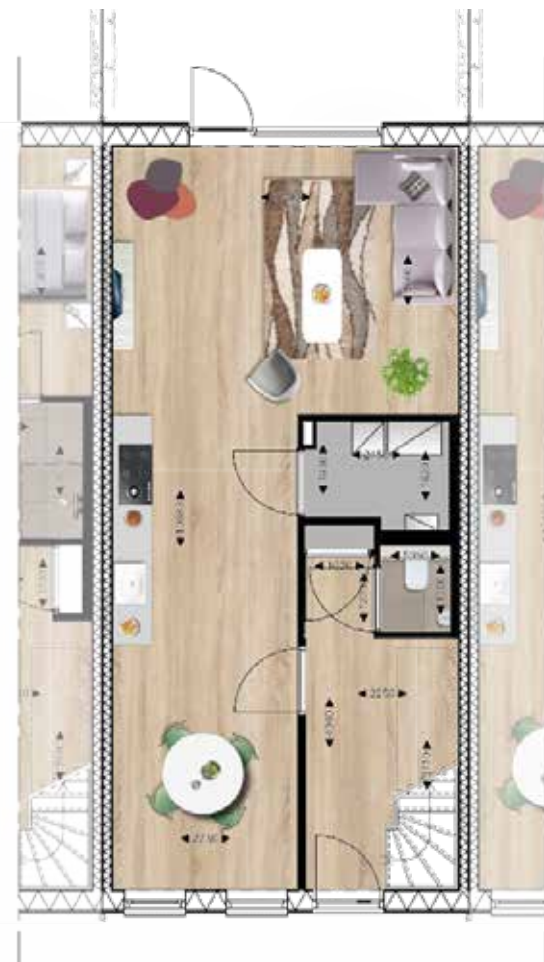
Tussenwoning Woonoppervlakte 96m 2