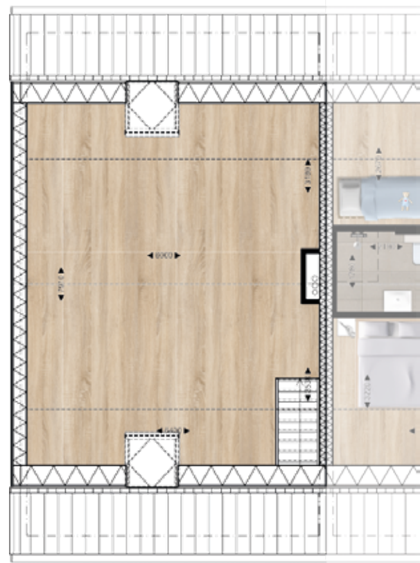
Hoekwoning Woonoppervlakte 119 m 2