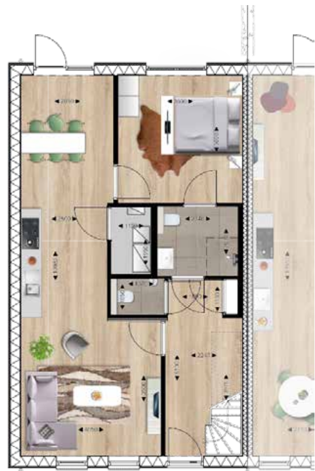
Optioneel begane grond zonder slaapkamer